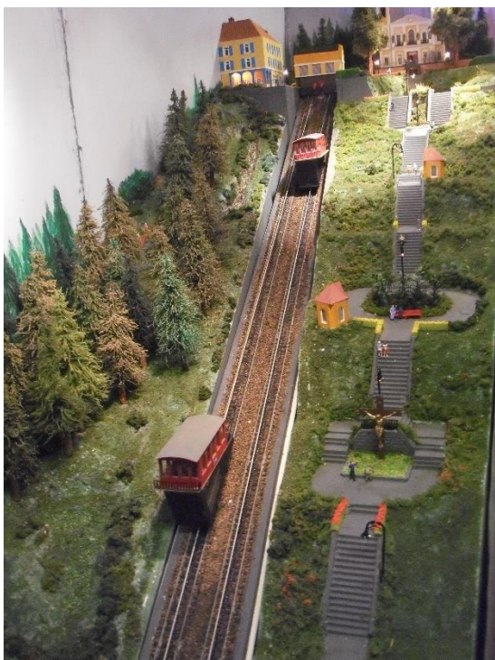
Figuur 4 Waterlift