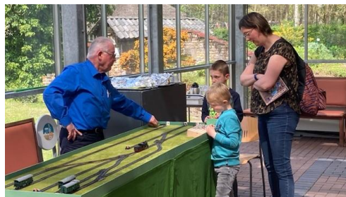
Figuur 1 Rangeerbaan

Daarnaast voor het eerst met de Waterlift en onze nieuwe rangeerbaan. Bij de rangeerbaan kregen de kinderen, na het goed afleggen van een rangeeropdracht, een rangeerdiploma.