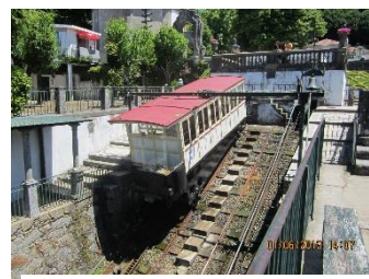
Figuur 3 Braga

De Waterlift is na een model van een lift in Braga, Portugal. Origineel werkte deze lift op basis van water. Onder elke cabine zit een bak die met water gevuld kan worden. Bij de cabine die boven staat laat men water in de bak lopen. Door het extra gewicht zakt de cabine naar beneden en trekt de cabine die beneden staat naar boven. Eenmaal beneden laat men het water uit de bak lopen. Dit was een zeer milieuvriendelijke aandrijving.