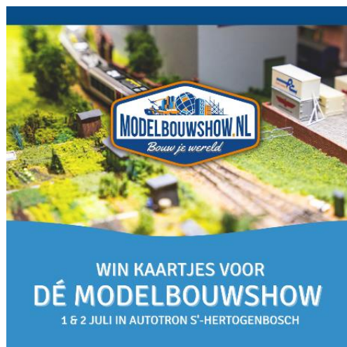
Figuur 1 Rosmalen Modelbouwshow

Voor meer informatie kijk in onze tentoonstellingsagenda op onze website onder " tentoonstellingen ".