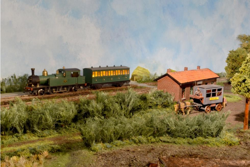
Alles is zelfbouw.

In de periode tussen 1900 en 1915 (locatie 6) neemt de vraag naar turfstrooisel en turf langzaam af, om tijdens de eerste en tweede wereldoorlog weer toe te nemen omdat de steenkoolproductie de vraag niet kan bijhouden. Aan het eind van de tweede wereldoorlog vinden er veel gevechten plaats in de Peel. De halte Helenaveen en de turfstrooiselfabrieken rond het huidige Griendstveen overleven de strijd niet en worden na de oorlog niet meer opgebouwd.