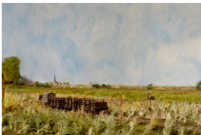
Turfwinning in de Peel

Daar staat ook onze baan "Turf". Over die baan leest u meer in deze Nieuwsbrief.