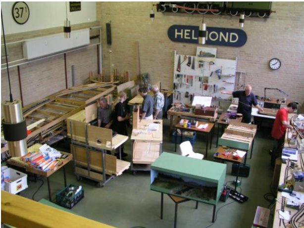
Zicht vanaf het balkon (bibliotheek)

Omdat de andere clubs geen gebruik meer van de ruimte maakten, gingen we een vaste clubbaan aanleggen. Die bleef "in aanleg" tot we het gebouw in 2006 moesten verlaten omdat het gebouw werd gesloopt om plaats te maken voor woningbouw.