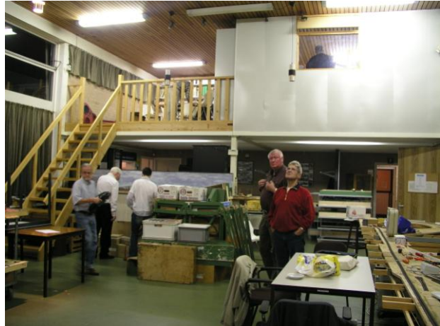
Zicht naar het balkon (bibliotheek)

Het gedeelte "Berging Amfibie" (zie plattegrond) werd al snel een clubwinkel. Dit als aanvulling op de eigen verkoop die we deden tijdens onze ruilbeurzen in het TOV- gebouw. En omdat de ruimte (een voormalige gymzaal van een school) zo hoog was, legden we ook nog een tussen-vloer aan in een deel van die zaal. De ruimte boven aan de trap werd gebruikt als bibliotheek en het afgesloten deel door de Märklingroep, die daar het Station Deurne heeft gebouwd.