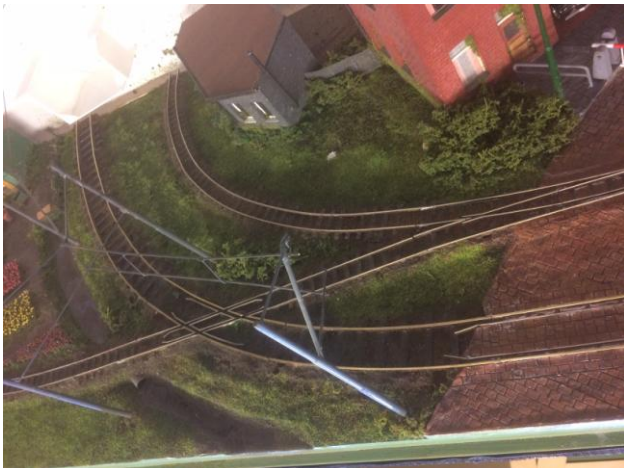
De bovenzijde van de module (Houthuizen)